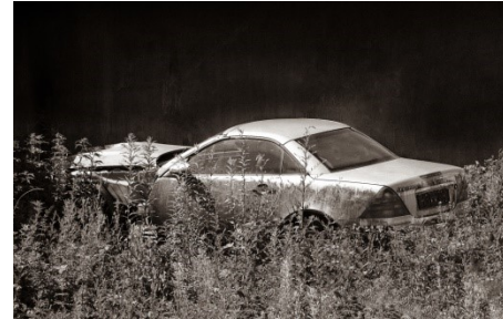
7. Thasso Hundisch