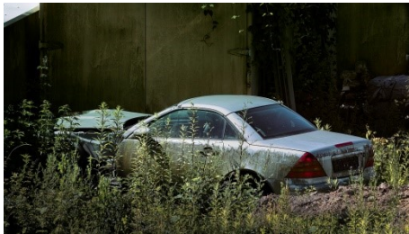
5. Jürgen Coppenrath