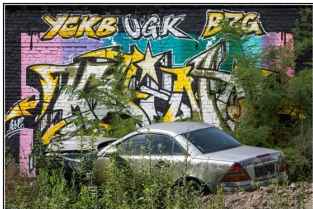
9. Rembert Pieper