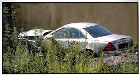
1. Uwe Ginter