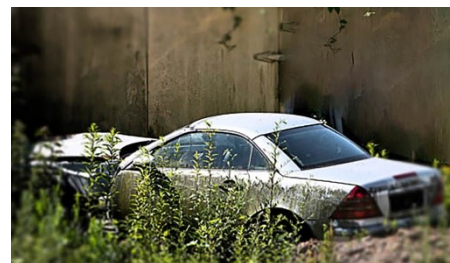
10. Gabi Nowak